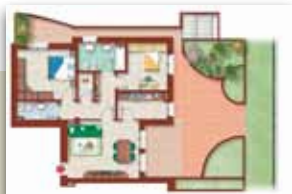
PIANO TERRA CON GIARDINO

Varie tipologie disponibili: bilocali, trilocali, attici con ampi terrazzi. Capitolato di pregio: riscaldamento a pavimento, pannelli solari e fotovoltaici, impianto di raffrescamento e deumidificazione a pavimento, sistema di riutilizzo delle acque piovane