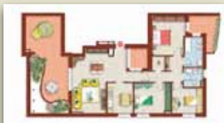
QUINTO PIANO CON BALCONE