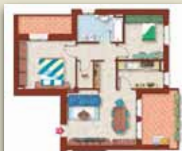
TERZO PIANO CON BALCONE