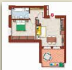
PRIMO PIANO CON BALCONE